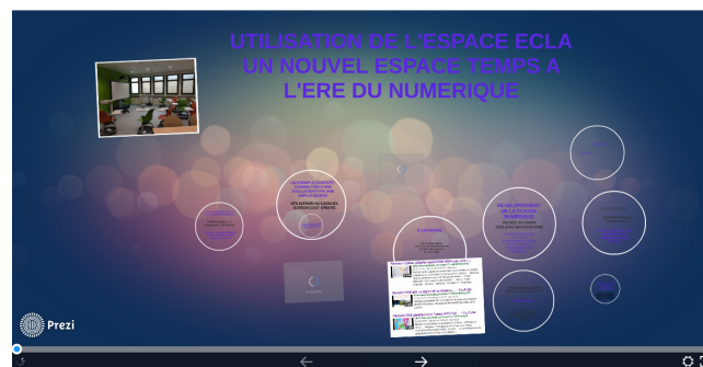
Figure 1. Voir la vidéo

Utilisation de l'espace ECLA Prezi en ligne [ https://prezi.com/mk7kdqr9hfzg/utilisation-de-lespace-ecla ]