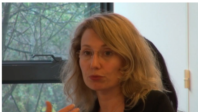
Figure 1. Présentation vidéo du 15 avril 2016

Ma présentation portera sur les conclusions sur mon mémoire de recherche "Cultures scolaires à l'ère du numérique : des mythes, des enjeux, des réalités" et sur un exemple d'utilisation des supports numériques et de liens Internet à travers la correction d'évaluations.