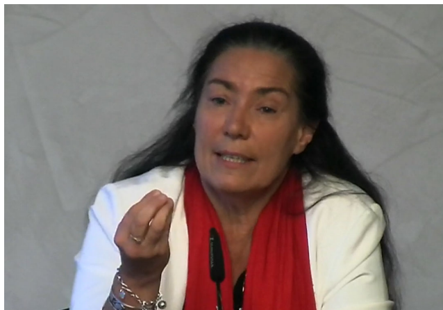
Figure 1. Voir la video simple

Télécharger le diaporama [ http://mediaserv.climatetmeteo.fr/users/Charles-HenriEyraud/EnseignerLeChangementClimatique/fichiers/20151112DiaporamaMoniqueDupuis.pdf ]