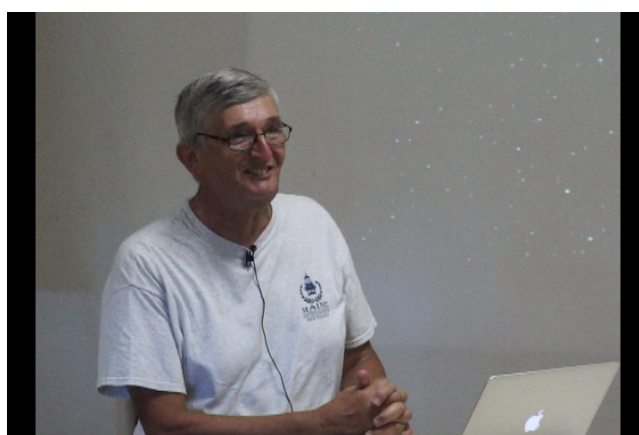
Figure 2. Voir la vidéo de la conférence "L'énigme du ciel noir"

Ecouter/Voir la video simple au format .mp4 [ http://videoserv.climatetmeteo.fr/2016/20160824/FrancoisMignard/Video/20160824_francoismignard.mp4 ] au format .webm [ http://videoserv.climatetmeteo.fr/2016/20160824/FrancoisMignard/Video/20160824_francoismignard.webm ]