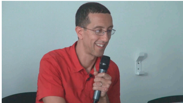
Figure 1. Voir la video du 15 avril 2016