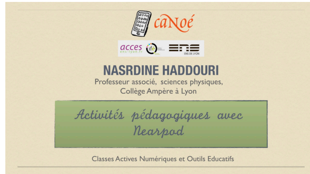
Figure 1. Voir la présentation vidéo du 16 septembre 2015