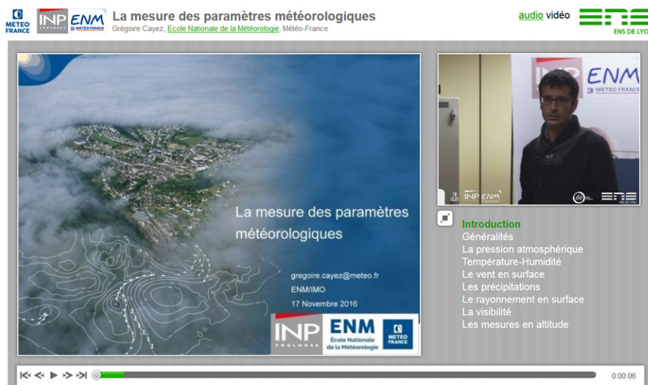
Figure 2. La mesure des paramètres météorologiques (Vidéo synchronisée)

Télécharger la video au format mp4 [http://videoserv.climatetmeteo.fr/2017/20171114/GregoireCayez/Video/20171114_GregoireCayez.mp4] au format webm [http://videoserv.climatetmeteo.fr/2017/20171114/GregoireCayez/Video/20171114_GregoireCayez.webm]