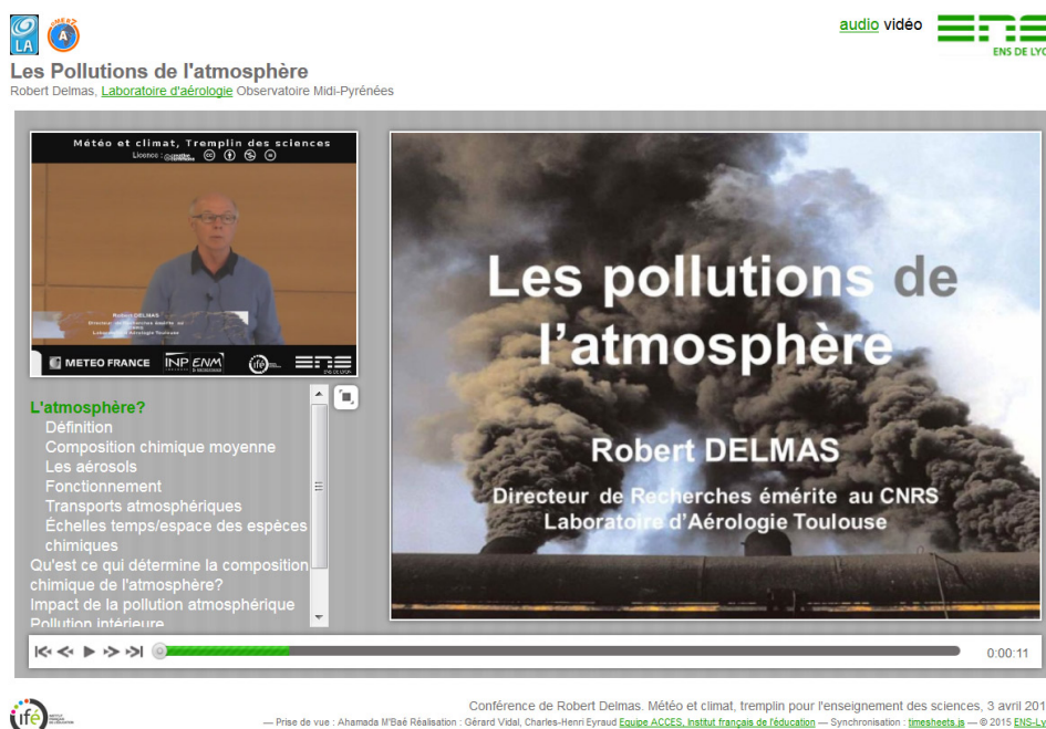
Figure 2. Les pollutions de l'atmosphère (Vidéo synchronisée)

Ecouter/Voir la conférence avec diapositives synchronisées [ http://videoserv.climatetmeteo.fr/2015/20150403/RobertDelmas/LesPollutionsDeLAtmosphere_video.html ]