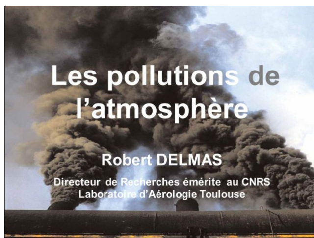
Figure 1. Les pollutions de l'atmosphère (Vidéo simple)

Télécharger la video au format mp4 [ http://videoserv.climatetmeteo.fr/2015/20150403/RobertDelmas/Video/20150403_RobertDelmas.mp4 ] au format webm [ http://videoserv.climatetmeteo.fr/2015/20150403/RobertDelmas/Video/20150403_RobertDelmas.webm ]