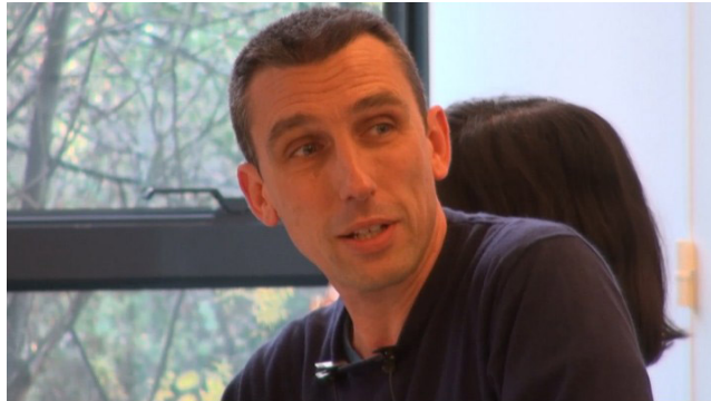
Figure 1. Présentation filmée du 15 avril 2016