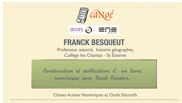
Figure 1. Présentation vidéo du 9 décembre 2015

Voir le tutoriel de Franck Besqueut Video [ https://youtu.be/EkfZQGturH8 ]