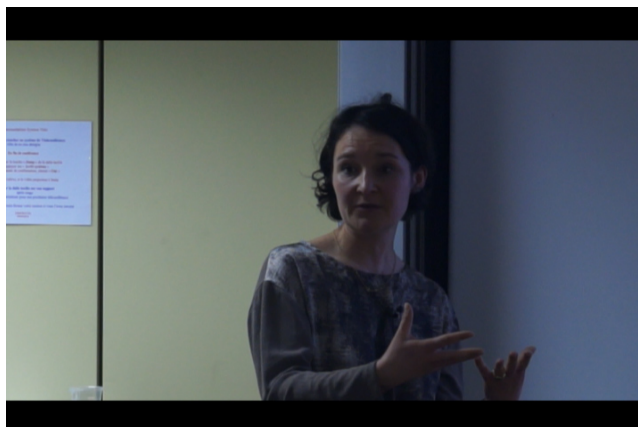
Figure 2. Voir la video simple