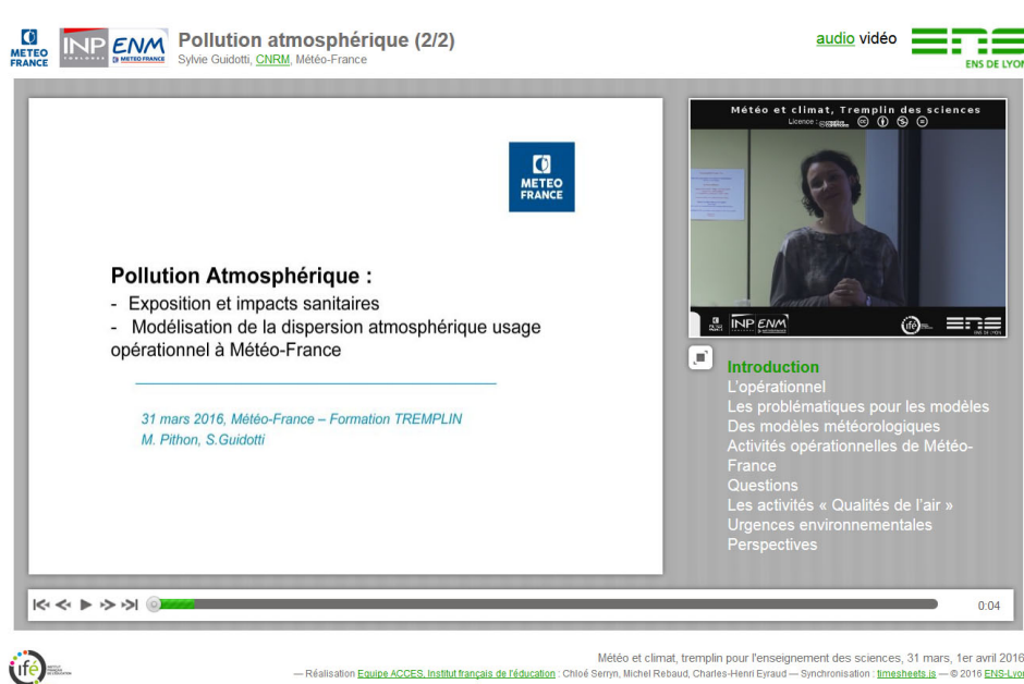
Figure 1. Conférence synchronisée audio ou vidéo

Ecouter/Voir la conférence avec diapositives synchronisées [ http://videoserv.climatetmeteo.fr/2016/20160331/SylvieGuidotti/pollutionatmospherique_video.html ]