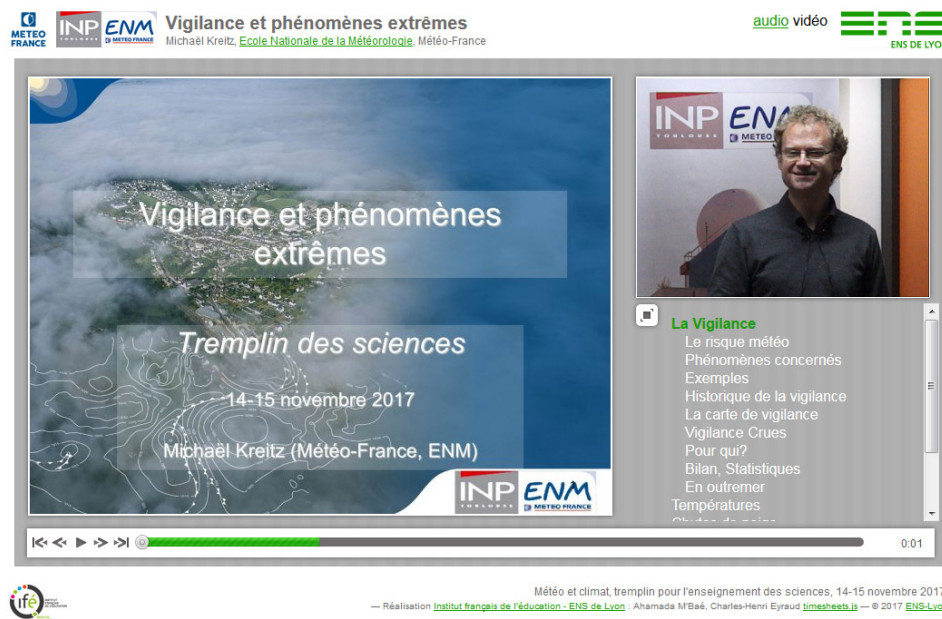
Figure 1. Conférence synchronisée audio ou vidéo

Ecouter/Voir la conférence avec diapositives synchronisées [ http://videoserv.climatetmeteo.fr/2017/20171115/MichaelKreitz/vigilanceetphenomenesextremes_video.html ]