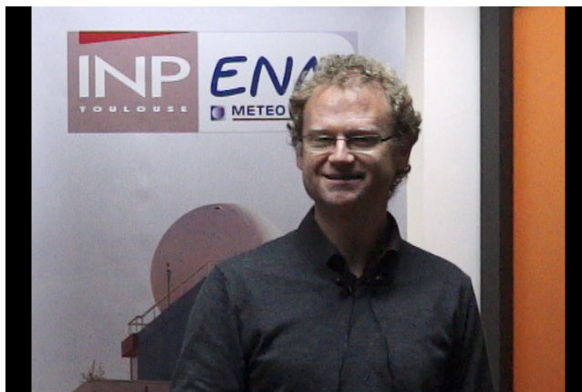
Figure 2. Voir la video simple

Télécharger la video au format mp4 [ http://videoserv.climatetmeteo.fr/2017/20171115/MichaelKreitz/Video/20171115_MichaelKreitz.mp4 ] au format webm [ http://videoserv.climatetmeteo.fr/2017/20171115/MichaelKreitz/Video/20171115_MichaelKreitz.webm ]