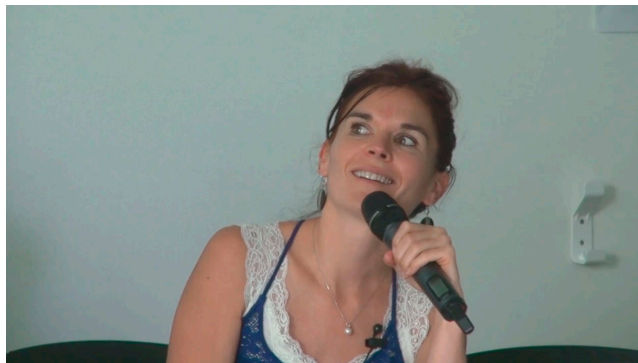
Figure 1. Voir la video

Télécharger le diaporama [ http://mediaserv.climatetmeteo.fr/users/PhilippeJeanjacquot/UtilisationDesOutilsNumeriquesEnClasse/fichiers/20150916DiaporamaSophieGuichard.pdf ]