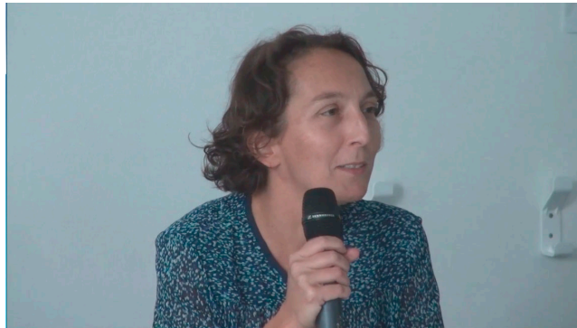
Figure 1. Voir la video

Télécharger le diaporama [ http://mediaserv.climatetmeteo.fr/users/PhilippeJeanjacquot/UtilisationDesOutilsNumeriquesEnClasse/fichiers/20150916DiaporamaFrancoiseVaillant.pdf ]