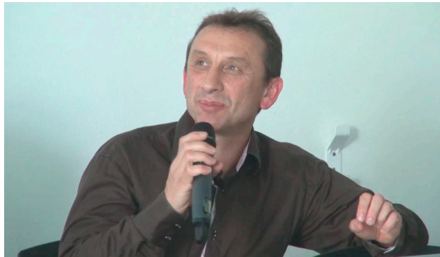
Figure 1. Voir la video

Télécharger le diaporama [ http://mediaserv.climatetmeteo.fr/users/PhilippeJeanjacquot/UtilisationDesOutilsNumeriquesEnClasse/fichiers/20150916DiaporamaAlainJeanneaux.pdf ]