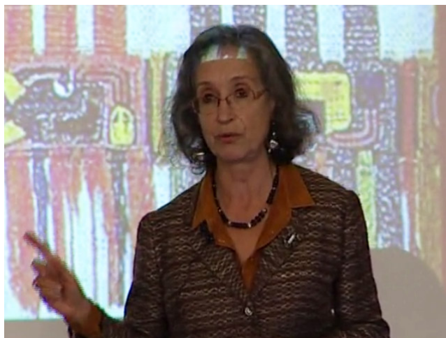
Figure 2. Voir la video "Conférencier"